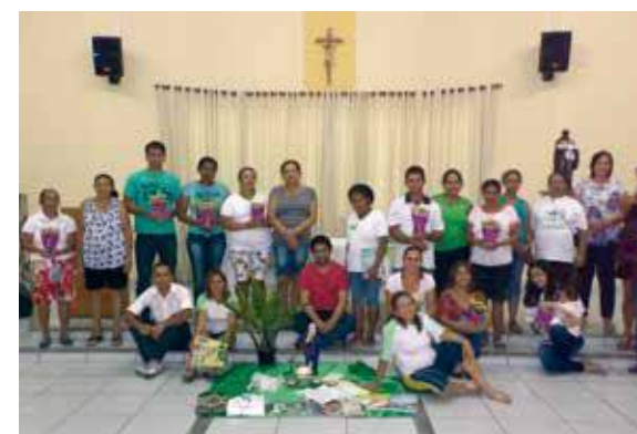
Capacitação para novos líderes.

A Pastoral da Criança, do Ramo Santa Rita de Cássia, encerrou mais uma capacitação para novos líderes. Eles já estão atuando em diversas comunidades da região, levando orientações para as famílias e celebrando a vida das crianças e gestantes acompanhadas.