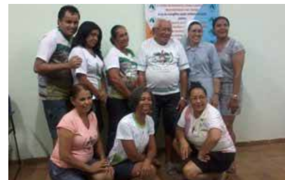
Líderes participam de capacitação.

O Setor Caxias do Maranhão desenvolveu uma série de atividades para dinamizar ainda mais a Pastoral da Criança. Entre elas, destacam-se as capacitações em Brinquedos e Brincadeiras e formação contínua.