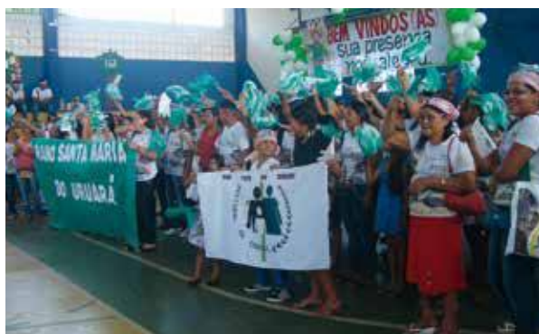
Pastoral da Criança: presença viva nas comunidades.

A Pastoral da Criança, na Diocese de Santarém, desenvolve de maneira ativa e criativa