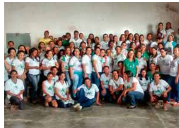
Líderes participam de evento especial.

A Pastoral da Criança do setor Estância organizou um dia de evento, com diversas oficinas como: Autoestima, Sistema de Informação, Fé e Política, Alimentação Saudável e Brinquedos e Brincadeiras. O momento foi muito enriquecedor e gratificante. Contamos com mais de 200 pessoas entre líderes, equipes de apoio e coordenações. São momentos como este que fazem os nossos líderes verem a sua importância e o tanto que a Pastoral da Criança necessita de mais voluntários para a grande messe do Senhor.