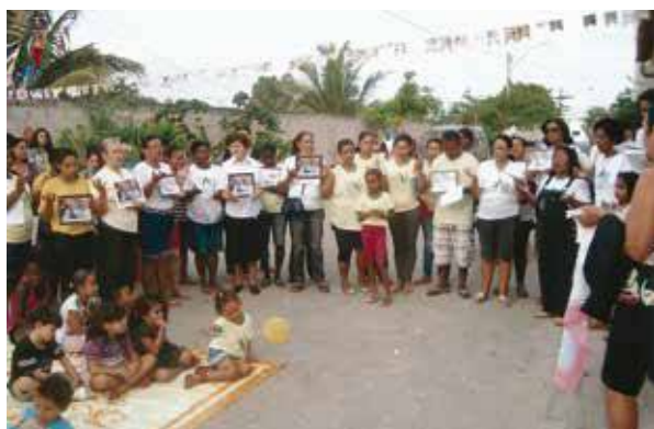
Participantes da festa para as crianças.