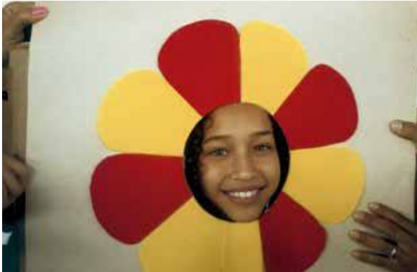
Crianças: as flores da Pastoral da Criança.

Em nossa cidade, Jundiaí, tivemos um desfile em que a Pastoral da Criança participou. As crianças representavam as flores. Tinha uma abelhinha. E, eu falei para as mães cuidarem bem destas lindas flores, para serem bem amadas e cuidadas. E, também, no momento da oração colocamos uma cadeira no centro da roda e Jesus sentou-se nesta cadeira, ficando ali acolhendo todos os nossos pecados e dificuldades. Isto foi maravilhoso.