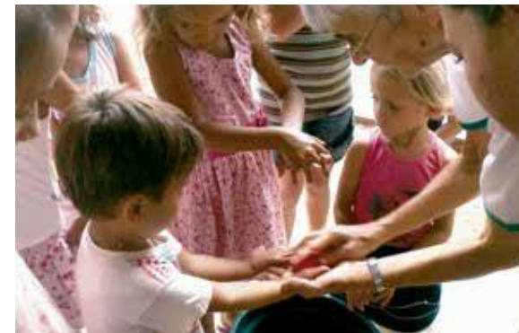
Lavar as mãos previne doenças.

A Campanha “Lavar as Mãos” foi um sucesso. Com início em uma reunião com todos os líderes e em parceria com a Secretaria de Saúde do município de Colniza abrimos a campanha com os materiais nas mãos. E, em todas as comunidades, foi iniciada a Campanha com muito entusiasmo e a certeza da mudança dos hábitos de higiene de crianças e suas famílias. No dia da Celebração da Vida, com as crianças receberam as primeiras orientações e foi uma festa o “lavar as mãos” corretamente durante os 21 dias da ação. Já estamos colhendo os resultados, não só nas crianças, mas, na comunidade foi uma experiência muito importante, pois é uma região carente e muito pobre. No Ramo São Sebastião foram colocadas as cinco principais doenças que normalmente ocorrem também pela falta de lavar as mãos: gripe, resfriado, tosse, diarreia e verminoses. O Programa “Vamos lavar as mãos” teve ótima aceitação. Foi trabalhado com palestras, nas creches com crianças e pais. Foi divulgado também na catequese, na Celebração da Vida, nas escolas e nas 18 comunidades do interior com muita aceitação e divulgação do programa na rádio, o Viva a Vida.