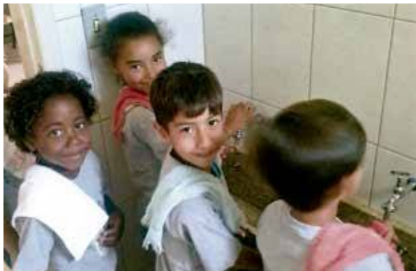
Crianças participam da campanha.

Todas as comunidades do Setor Campanha participaram ativamente da campanha “Lavar as Mãos”. Foi muito bom, porque nós, líderes, já aprendemos muita coisa boa que a Pastoral da Criança nos ensina como: alimentação saudável, melhor maneira do bebê dormir e agora este tema tão importante para prevenir doenças. Atualmente, todas as crianças participam da aprendizagem sobre este tema, inclusive, ensinando os irmãos maiores das famílias.