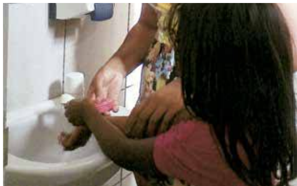
Crianças aprendem a lavar as mãos de forma correta.

Fizemos o trabalho com as crianças sobre a Campanha Lavar as Mãos e tivemos um bom resultado. Iniciamos com explicações e a entrega das apostilas, ensinando quando e como devemos lavar as mãos. Na Celebração da Vida ouvimos depoimentos das mães sobre as mudanças de hábito que observaram dentro de casa. Concluimos com os selinhos e, depois, os adesivos nas mãos das crianças parabenizando-as, pois, agora sabem se proteger contra as doenças.