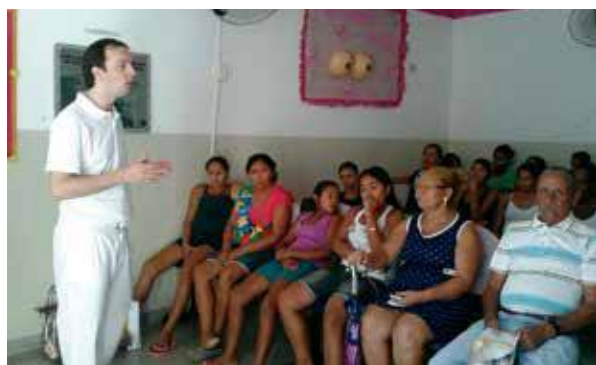
Palestra sobre saúde bucal.

A Pastoral da Criança faz a diferença no acompanhamento às famílias, em especial