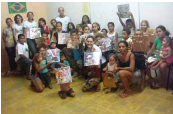
Crianças começam a tomar gosto pela leitura.

A Pastoral da Criança da Diocese de Caicó, Paróquia de Nossa Senhora da Guia, município de Acari, realizou a Celebração da Vida nas comunidades Petrópolis I e II, Terezinha Pereira