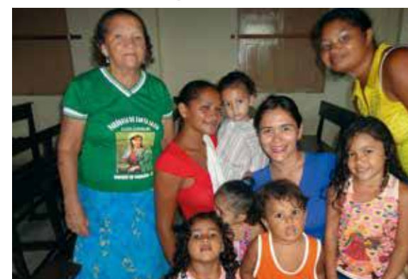
Celebração reúne famílias e comunidades.