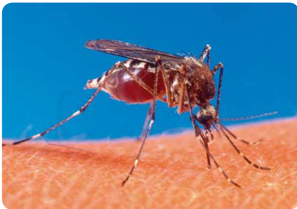
Aedes aegypti - Foto: US Department of Agriculture Licenciado sob Domínio Público, via Wikimedia Commons.

Prezado líder, em abril de 2014, a Fundação Oswaldo Cruz (Fiocruz), uma entidade muito respeitada na área de saúde, alertou para a possibilidade de o vírus chikungunya se espalhar pelo Brasil e outros países da América do Sul. O vírus causou epidemias na Ásia, África, Europa e Caribe. A doença chikungunya (palavra originada na Tanzânia que significa ficar contorcido ou curvado por causa das dores nas articulações) tem sintomas parecidos com a dengue e também é transmitida pelo mosquito Aedes aegypti . Um estudo desenvolvido pelo Instituto Oswaldo Cruz (IOC/Fiocruz), em parceria com o Instituto Pasteur, revelou que, em cidades populosas com grande infestação do mosquito, o risco da doença se espalhar é alto.