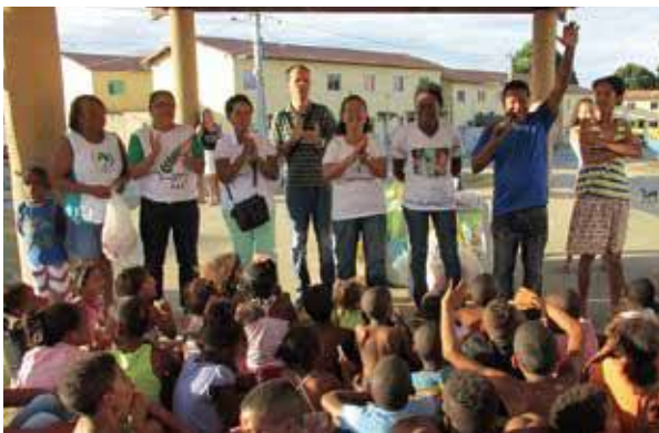
Líderes realizam momento de espiritualidade.

A Pastoral da Criança proporcionou momentos de evangelização e diversão no Conjunto Zilda Arns, Ramo Santo Antônio, município de Santo Antônio de Jesus. A Celebração da Vida aconteceu com a presença