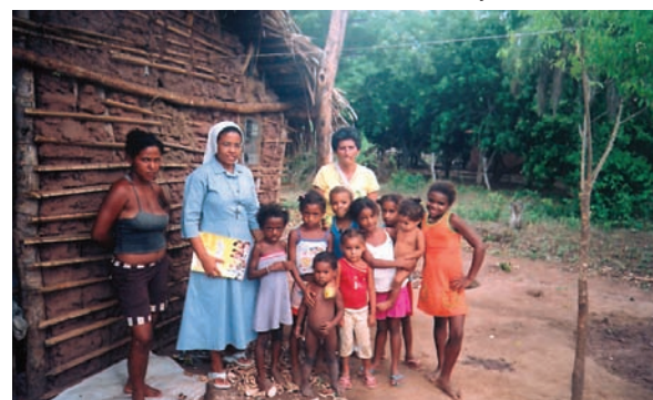
Pastoral da Criança chega a uma nova comunidade.