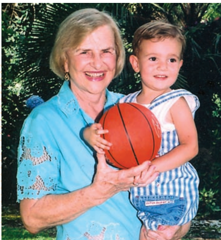
Dra. Zilda Arns Neumann Fundadora e Coordenadora Internacional da Pastoral da Criança. Coordenadora Nacional da Pastoral da Pessoa Idosa. Representante Titular da CNBB no Conselho Nacional de Saúde. Conselheira do Conselho de Desenvolvimento Econômico e Social da Presidência da República.

Queridos(as) Líderes, Querido(a) coordenador(a)