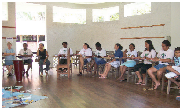
Líderes se reúnem na Prelazia do Xingu.