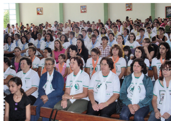
Líderes se encontram para partilhar experiências.

Algumas apresentações culturais marcaram o encerramento do evento.