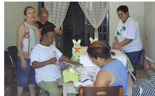
Capacitação em trabalhos manuais.