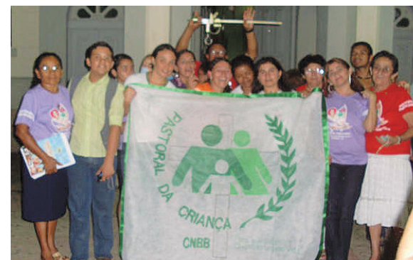
Envio de missionários leigos.

A Paróquia Nossa Senhora do Perpétuo Socorro do município de Acopiara recebeu com grande alegria, no dia 15 de janeiro de 2009, duas missionárias foram acolhidas pela Coordenação de Setor, coordenação Paroquial e pela equipe de apoio já existente na paróquia. As missionárias contam com o valioso apoio da Irmã Regina, que desde do início vem acompanhando a implantação da Pastoral da Criança na paróquia. Foi realizada também a celebração de envio dos líderes capacitados em 2008 e, ao mesmo tempo, de acolhida e envio das missionárias na paróquia de Acopiara. Estamos muito felizes pela chegada das missionárias, desejando as boas vindas na paróquia. As