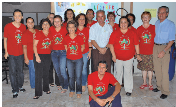
Festa para comemorar os 15 anos da Pastoral da Criança.

Agradecemos a Deus por tudo que Ele operou nesta caminhada. Parabéns e obrigada a todos os líderes, equipes que sempre se dedicaram com amor e responsabilidade e que continuam firmes e perseverantes com fé e coragem enfrentando desafios para esta missão bela e árdua na busca de mais vida para todos.