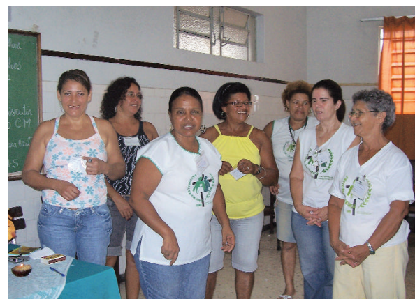
Reunião de Articuladores.

Isso foi o nosso novo compromisso. Para iniciar esse trabalho é preciso ter coragem e dedicação. Todos mostraram disposição e vontade.