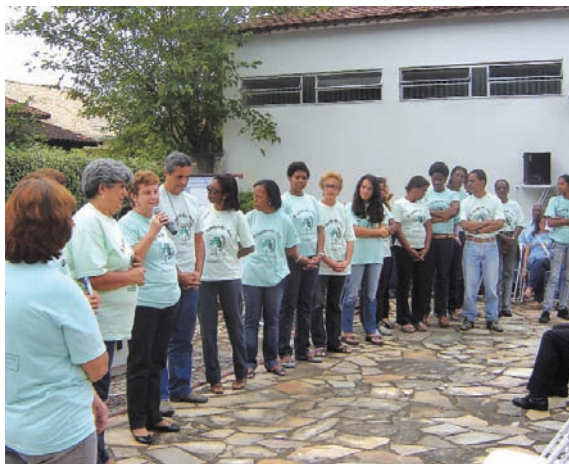
Missa de envio de novos líderes.

No dia 26 de abril, juntamente, com a abertura do Ano Catequético em Porto Real, foi