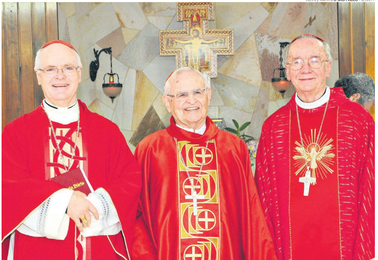
Dom Paulo Evaristo Arns ao lado dos dois arcebispos que lhe sucederam na Arquidiocese: Dom Odilo Pedro Scherer e Dom Cláudio Hummes