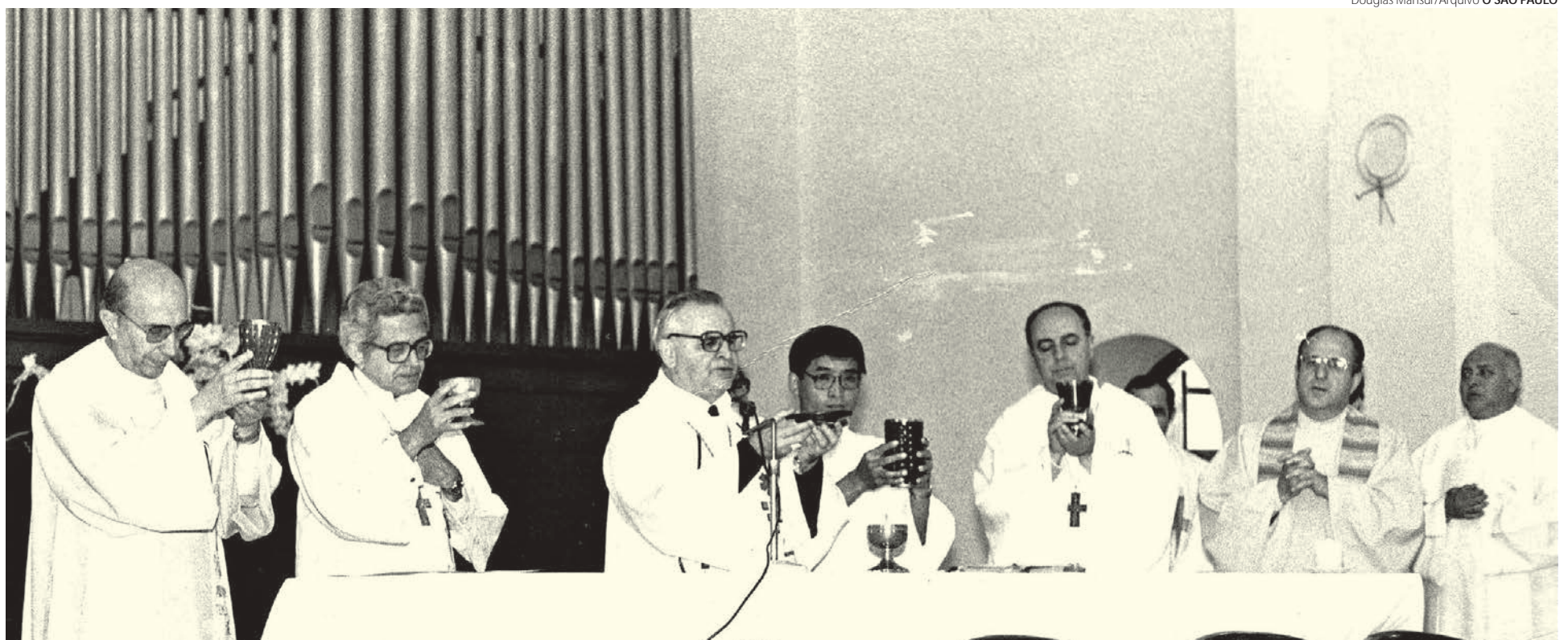
Cardeal Paulo Evaristo Arns em celebração na Igreja Imaculada Conceição, anexa às Faculdades de Filosofia e Teologia, no bairro do Ipiranga, na zona Sul, onde estudam os seminaristas