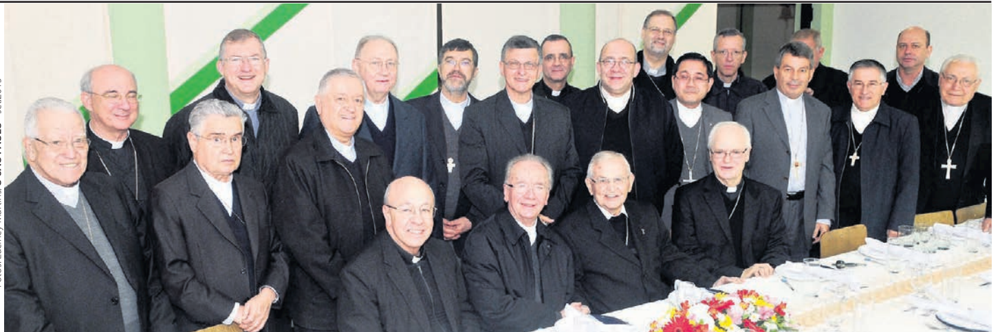
Dom Paulo Evaristo Arns □ homenageado por bispos titulares, auxiliares e eméritos de dioceses da Província Eclesiástica de São Paulo em 2015