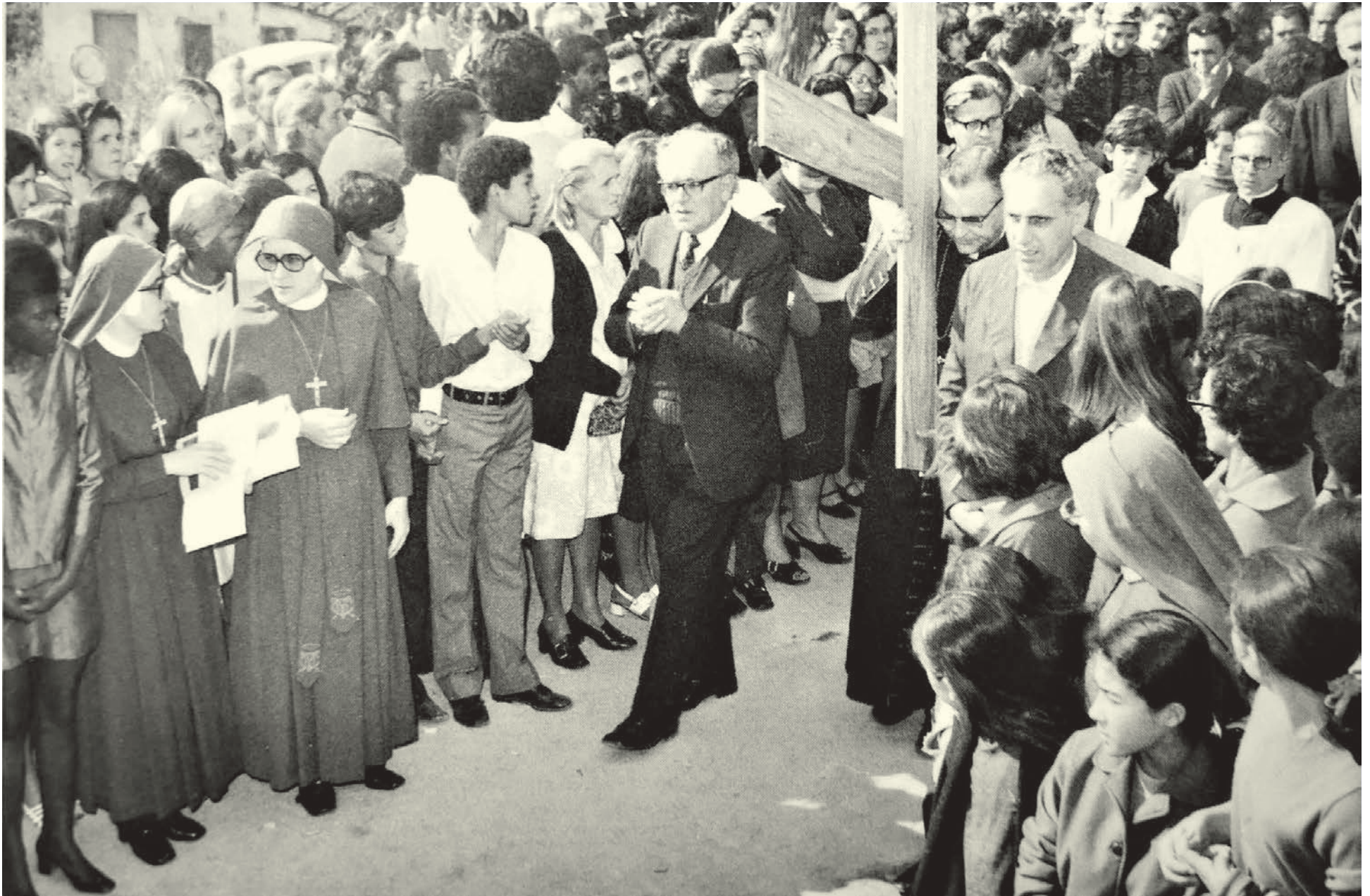
Dom Paulo Evaristo Arns em visita a uma comunidade paroquial da Região Norte na época em que era Bispo Auxiliar, iniciativa que ele manteve também como Arcebispo entre 1970 e 1998

CLERO, RELIGIOSOS E LEIGOS FORAM CHAMADOS À MAIOR PARTICIPAÇÃO NA VIDA ECLESIAL A PARTIR DA SEGUNDA METADE DOS ANOS 1960