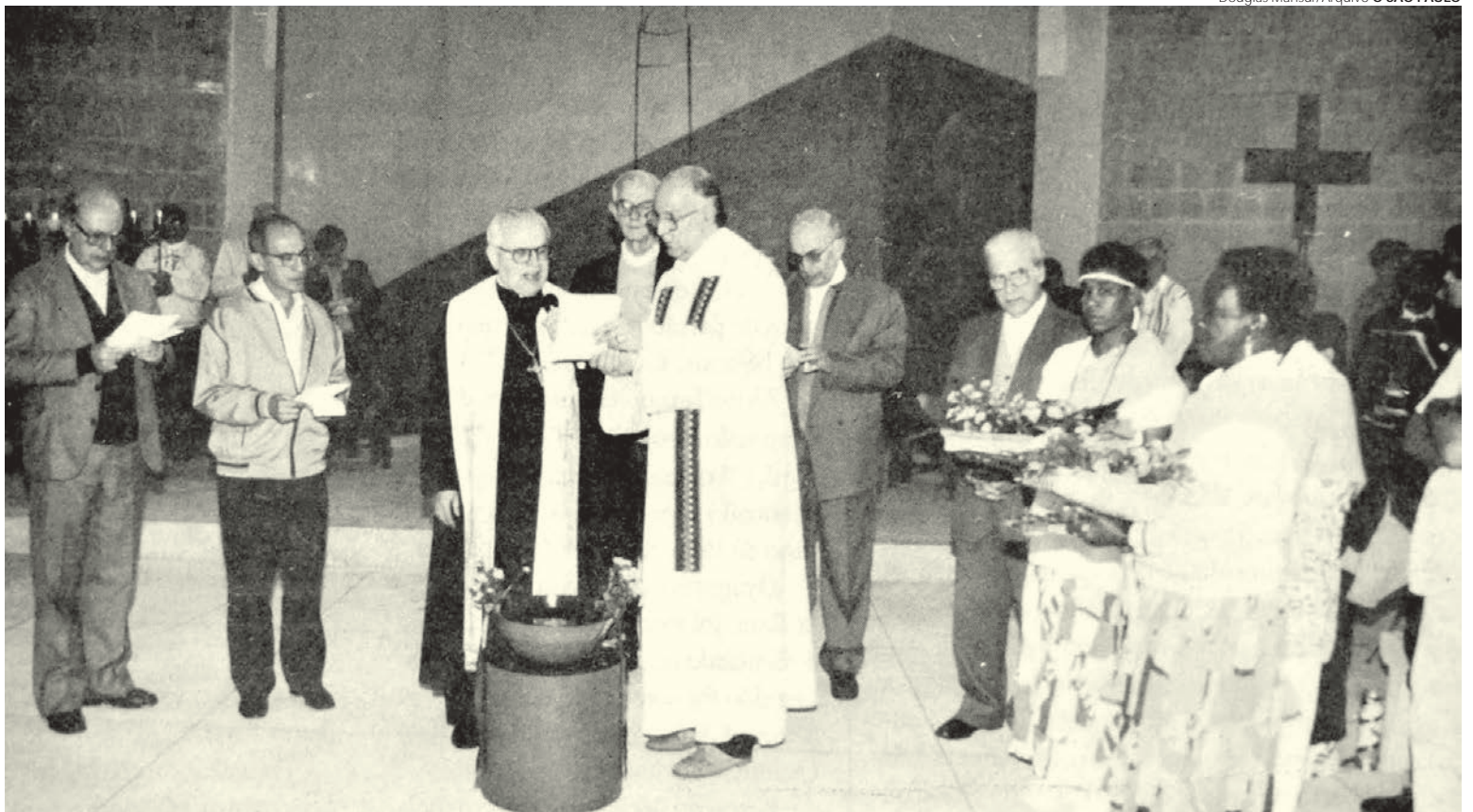
Ao lado dos bispos auxiliares e do Padre Jlio Lancellotti, Dom Paulo Evaristo abençoa e inaugura a Casa de Oração do Povo da Rua em 1997

A Casa de Oração do Povo da Rua foi inaugurada em 28 de junho de 1997 e ainda hoje realiza atividades de evangelização, distribui refeições e roupas aos “irmãos da rua” e, em situações emergenciais, como na onda de