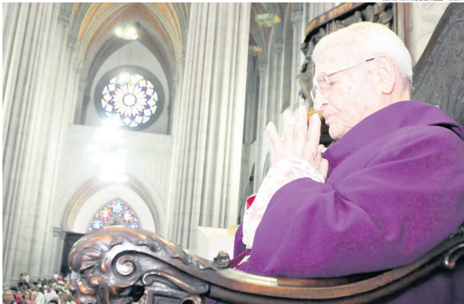
Dom Paulo em missa na Catedral da Sé: Rezar é a missão mais essencial de todo o cristão que assume seu Batismo, sua união com Cristo

A celebração aos domingos, conduzidas pelos professores, além de recordar o Dia do Senhor, representava o encontro do povo com Deus, o reencontro das famílias e o enaltecimento da vida. A família Arns nutria profunda devoção a Nossa Senhora e, todas as noites, rezava pelas vocações.