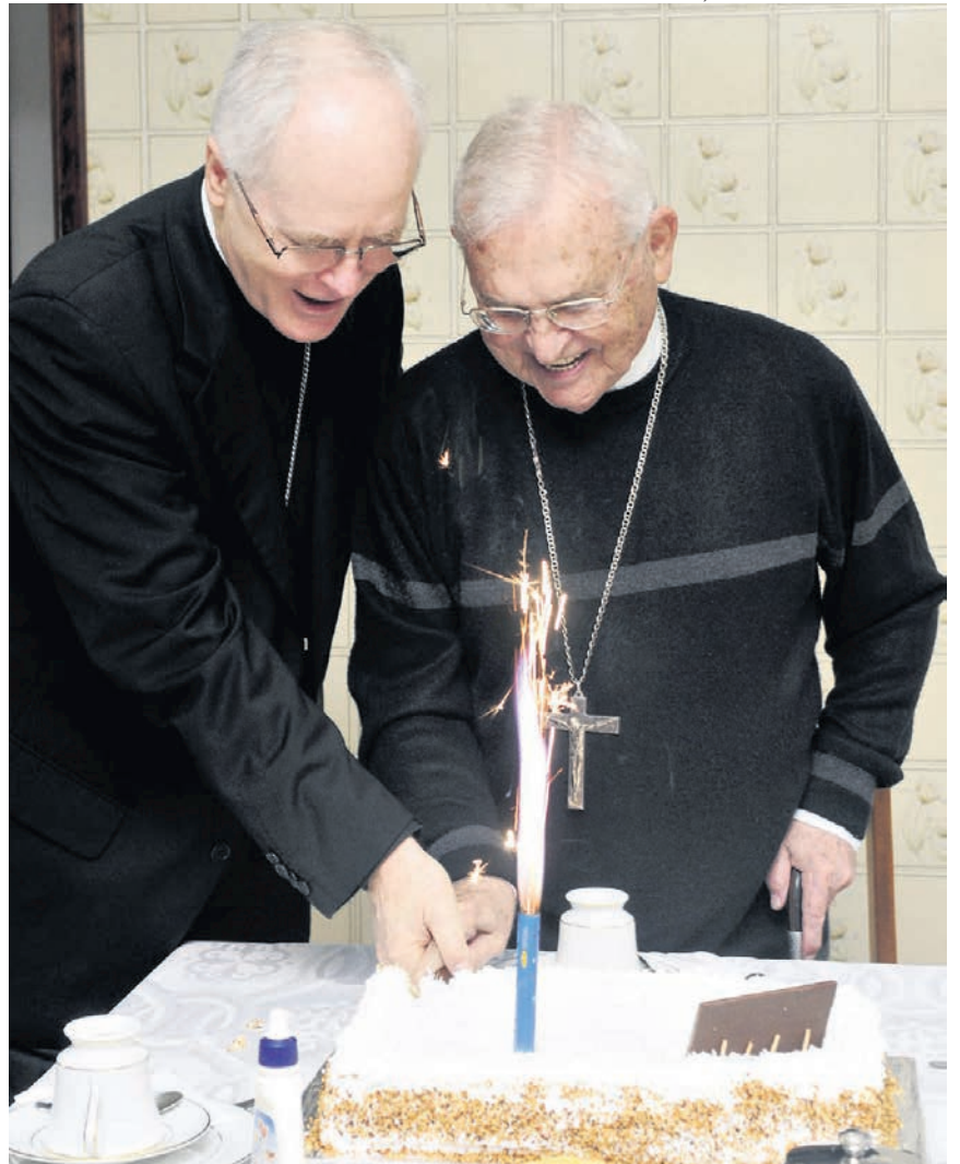
Cardenal Odilo Scherer participa do aniversário de 88 anos do Cardeal Arns, em 2009