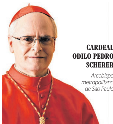
CARDEAL ODILO PEDRO SCHERER