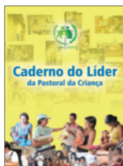
Caderno do Líder