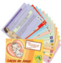
Laços de Amor