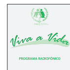
Programa de rádio Viva a Vida

Outras ferramentas: balança, Cartão da gestante e Cademeta da Criança.