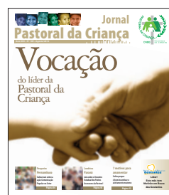
Jornal da Pastoral da Criança